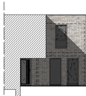
VOORGEVEL schaal 1/200