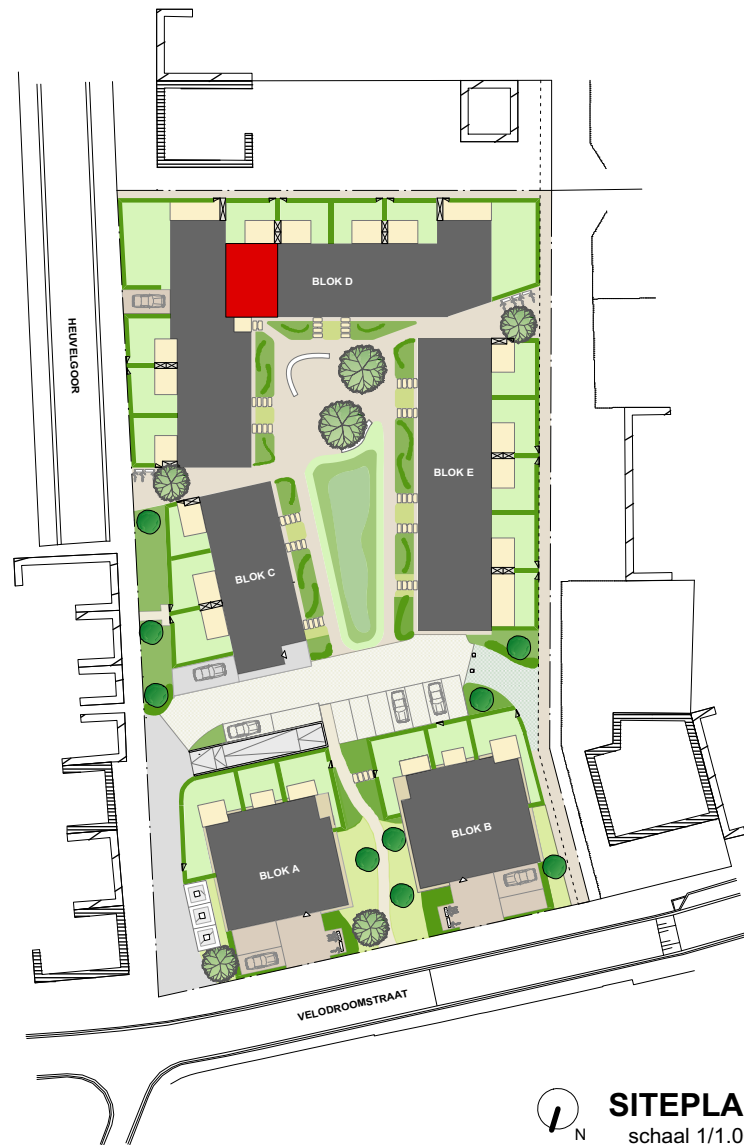
SITEPLAN schaal 1/1.000